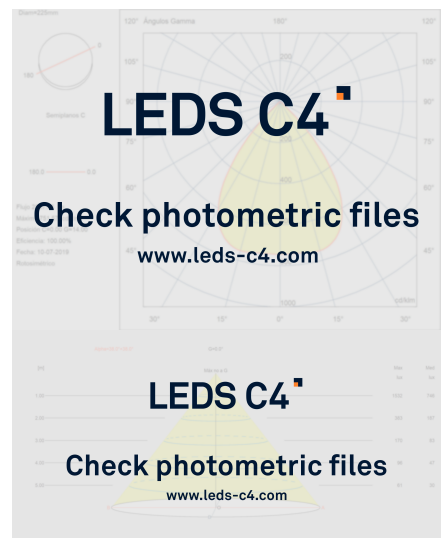
Fotometría realizada con una bombilla estándar

La imagen puede no coincidir con la referencia, LedsC4 se reserva el derecho de modificación de alguno de los componentes que componen el producto. Los datos relativos al flujo, la potencia y la temperatura de color pueden estar sujetos a cambios del fabricante.